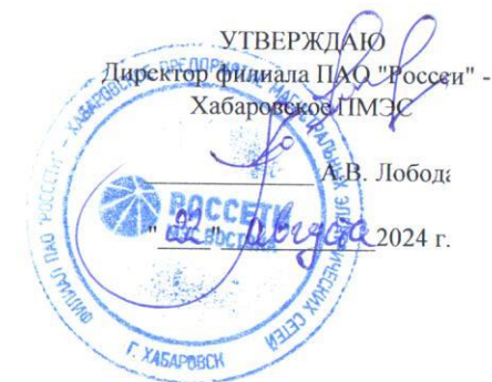
ГРАФИК ограничения режима потребления электрической мощности на 2024/2025 гг. по филиалу ПАО "Россети" - Хабаровское ПМЭС на территории Еврейской автономной области