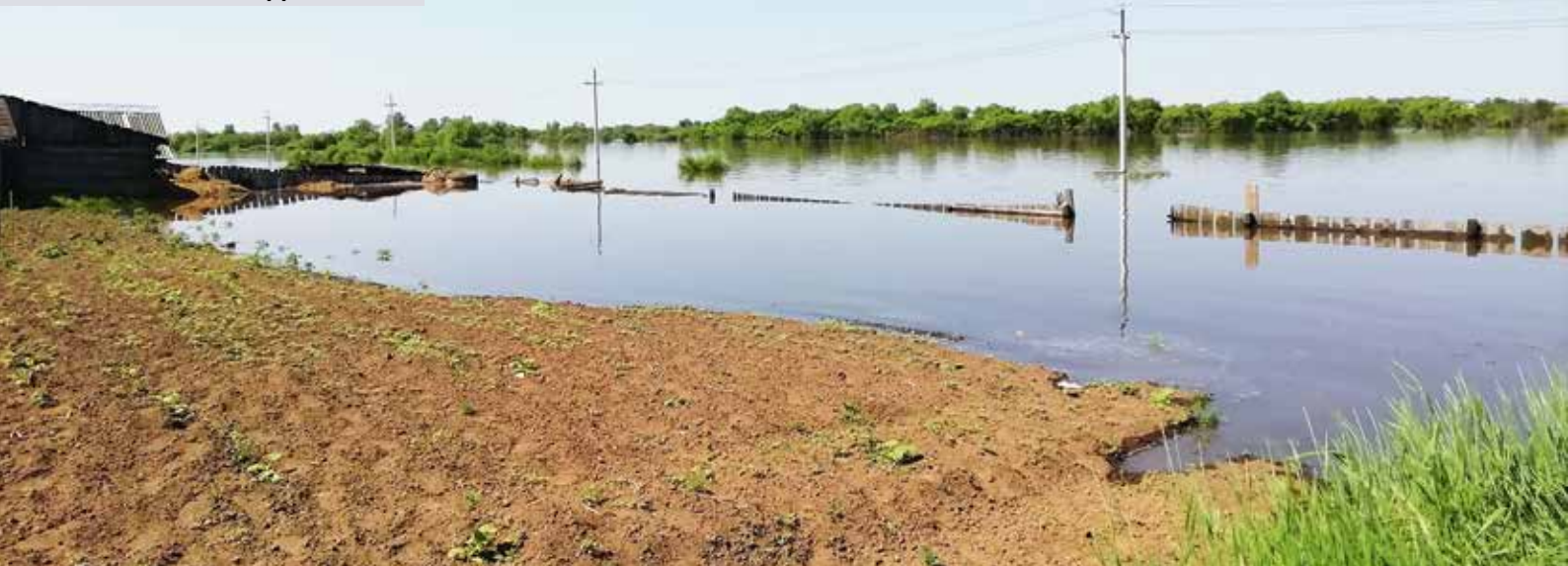
Ф4-10 ПС 35 кВ «Воскресеновка». 24.06.2021 г.