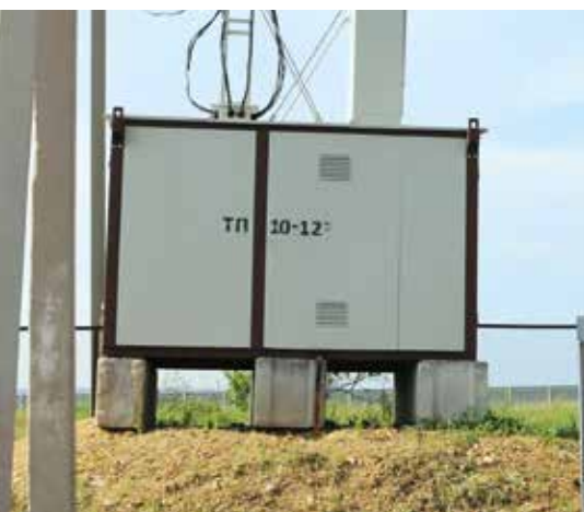
Владимировка. Подняли оборудование после 2013 года

Паводок в 2021 году в Амурской области побил рекорды 2013 и 1984 годов по подъему уровня реки Амур в районе Благовещенска. Под воду ушли тысячи гектаров земли вдоль Амура, оказались затопленными населенные пункты. Благовещенцы с тревогой смотрели на Амур – зайдет он в город или набережная удержит воду.