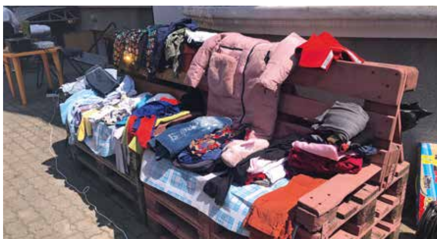
Вторая жизнь ненужным вещам. Ярмарка

Некоторые из респондентов с удовольствием бы стали участниками корпоративной экологической акции по очистке берегов рек и других многочисленных водоемов Хабаровского края от хлама и мусора. И возможно, очень скоро подобного рода активности тоже станут вполне привычным добрым делом для большинства персонала.