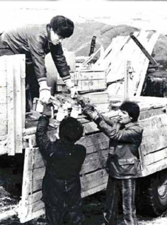
Субботник. 19 апреля 1980 года