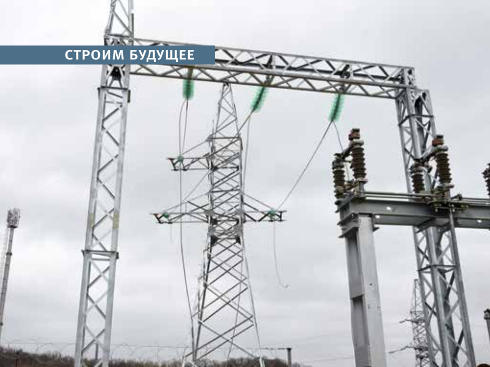
Новый энергообъект в г. Артем ПС 35/6 кВ «Ульяновская»

рублей. Из них 1,5 млрд – это заемные средства, предусмотренные для реализации первого этапа программы МиРЭК.