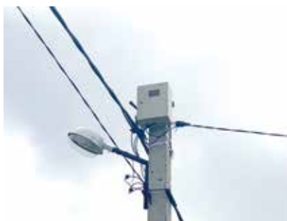
ПУ на границе балансовой принадлежности

✓ по организации двунаправленного коммерческого учета электрической энергии в точке присоединения.