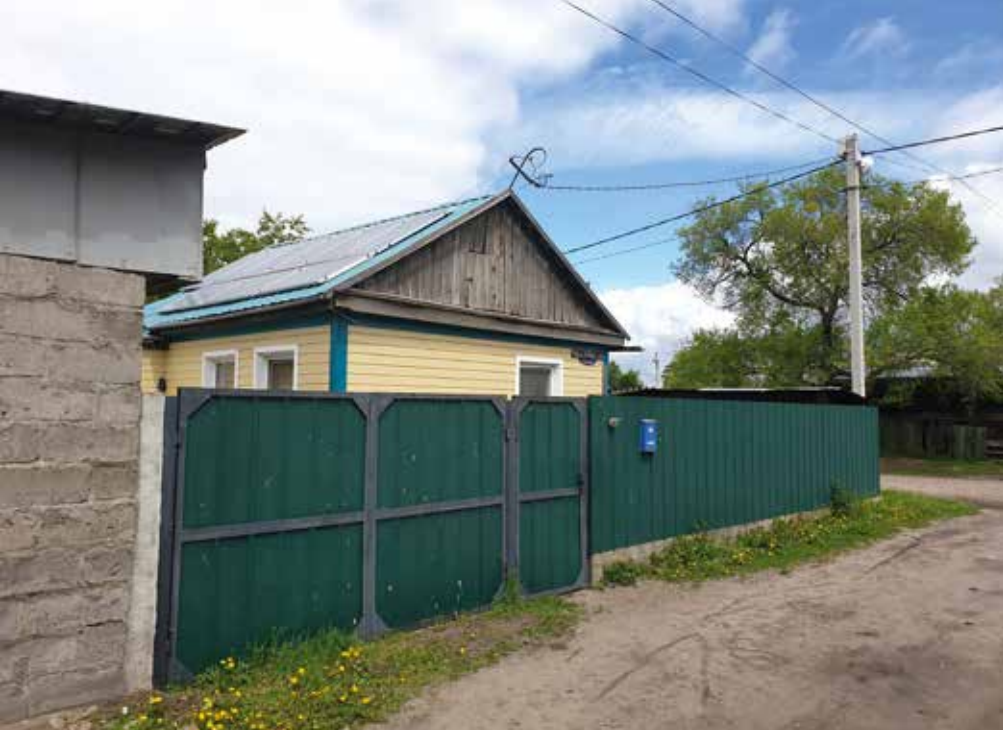
В Белогорске появились первые объекты микрогенерации

Согласно документу объектом микрогенерации считается объект по производству электрической энергии, принадлежащий на законном основании потребителю электрической энергии, энергопринимающие устройства которого технологически присоединены к объектам электросетевого хозяйства с уровнем напряжения до 1000 вольт, функционирующие в том числе на основе возобновляемых источников энергии.