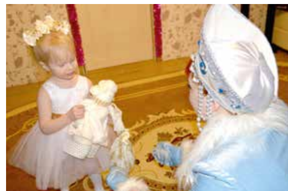
Новогодние поздравления детей сотрудников

В почете здесь и ветераны, ушедшие на заслуженный отдых, которые не остаются без внимания, и семьи, где рождаются малыши. Профсоюз рассматривает и материальную помощь работникам, нуждающимся в лечении, и выделяет деньги на погребение близких родственников... Одним словом, лидеры профсоюза алданских энергетиков не только стоят на страже четкого выполнения всех пунктов коллективного договора, заключенного на основании отраслевого соглашения ЯРОО «Электропрофсоюз», но и сами являются инициаторами многих добрых дел, которыми отличается предприятие.