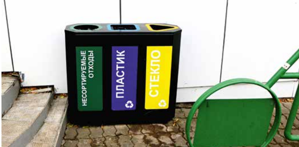
Раздельный сбор мусора. Хабаровск