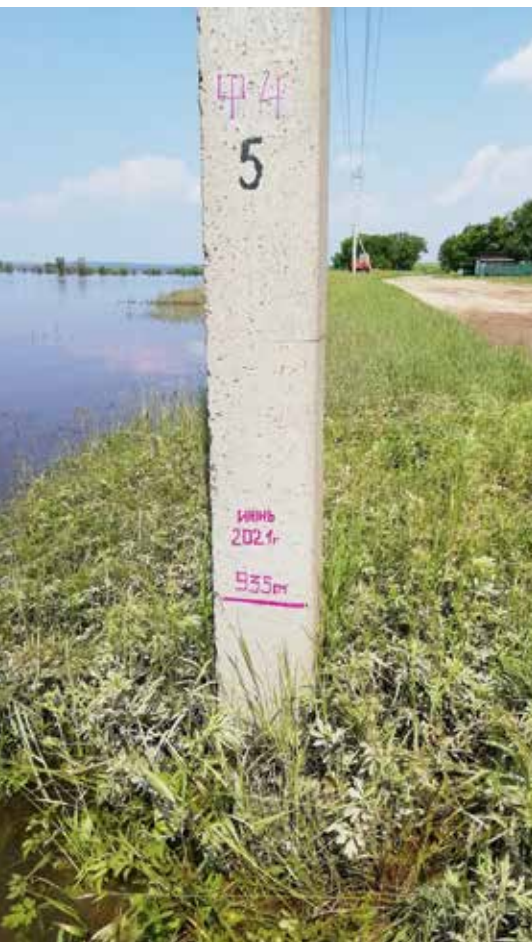
Воскресеновка. Уровень воды обозначен на опоре

подстанции и подключали к электроснабжению дома. Техника у них на участке была, ГСМ мы завезли до паводка. Для наращивания темпов работ 30 июня на теплоходе МЧС в Сергеевку по Амуру отправили ивановскую бригаду и всё необходимое оборудование для автономной работы в селе, отрезанном водой, - тепловые пушки, топливо, необходимый такелаж, новое оборудование для замены вышедшего из строя, воду и продукты. Катера МЧС также доставляли наши бригады в Марково.