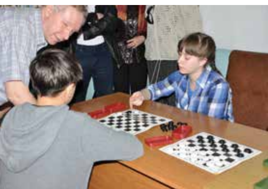
Соревнования среди детей сотрудников по шахматам. 2013 год