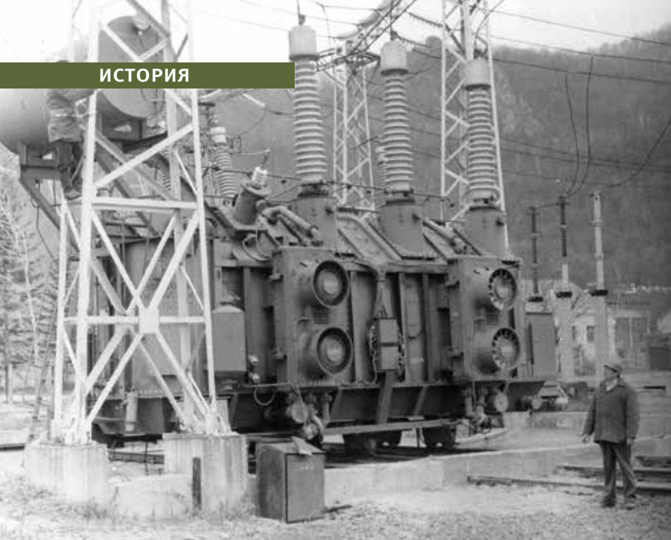
Монтаж автотрансформатора 125 МВА на ПС 220 кВ «Горелое», Дальнегорский УЭС ОРЭС, 1981 год

с наступлением тепла начинается ремонт, а мониторинг и оперативное реагирование осуществляется в круглосуточном режиме. В случае возникновения аварийных ситуаций у специалистов по регламенту есть всего 1,5-2 часа, для того чтобы собраться и выехать на место. В любое время суток, в любой сезон, в любую погоду энергетики готовы к работе.