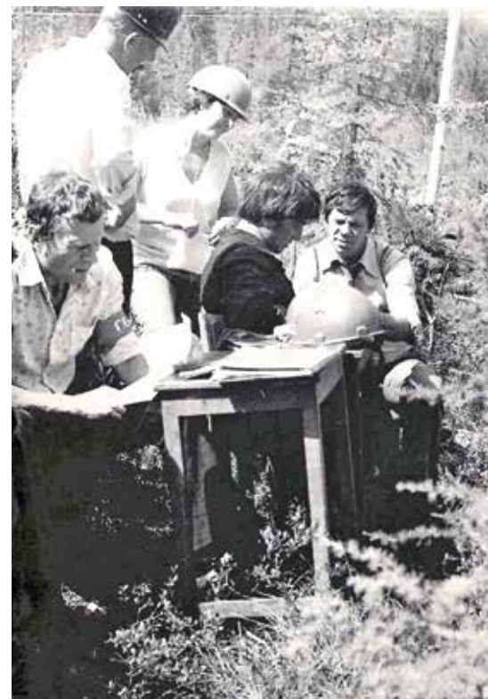
Конкурс по охране труда среди бригад