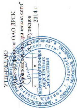
ГРАФИК временного отключения потребления на 2014 / 2015гг. по филиалу ОАО "ДРСК" Хабаровские электрические сети по Советско-Гаванскому энергорайону