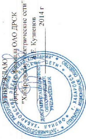
ГРАФИК временного отключения потребления на 2014 / 2015гг. по филиалу ОАО "ДРСК" Хабаровские электрические сети по Советско-Гаванскому энергорайону