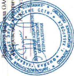
ГРАФИК временного отключения потребления на 2014 / 2015гг. по филиалу ОАО "ДРСК" - "Хабаровские электрические сети" по Комсомольскому энергорайону

Директор филиала ОАО "ДРСК" Хабаровские электрические сети 2014 г