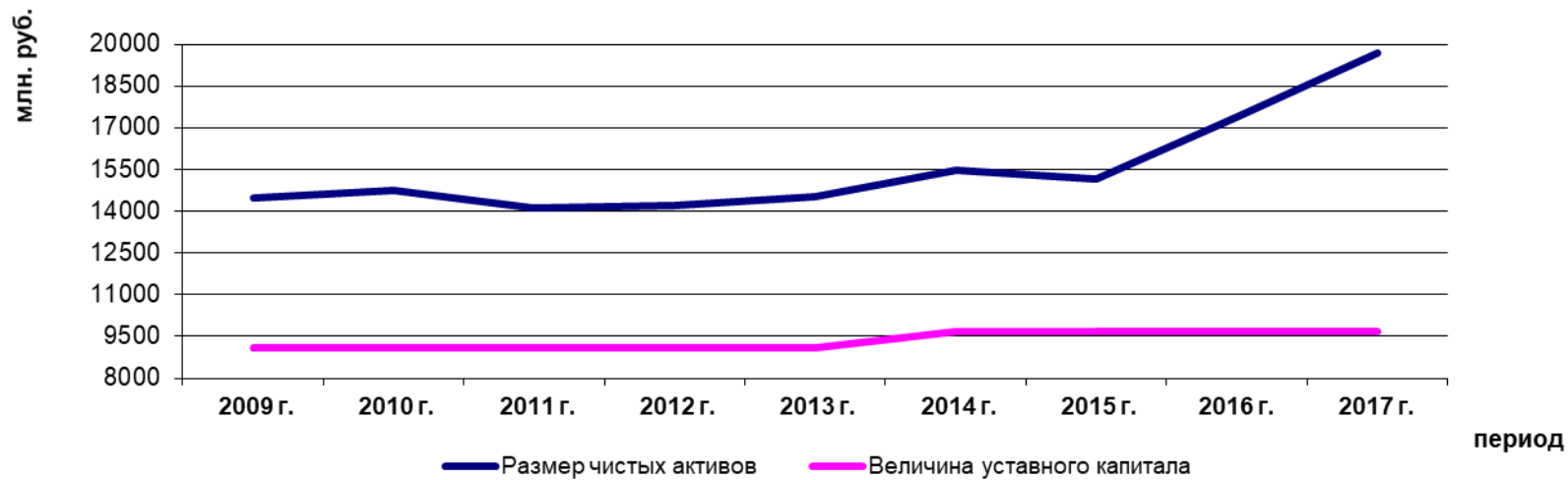
Динамика чистых активов АО "ДРСК"